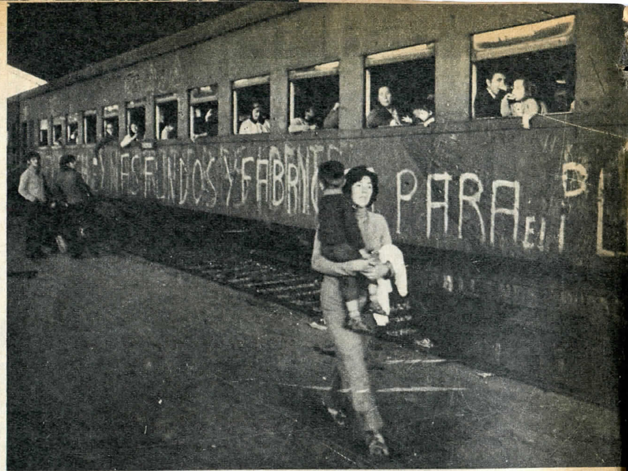
LOS QUE VIENEN... Según las últimas estadísticas, hay en Santiago un millón de personas más que en 1970. Son los desesperados que abandonan el campo y se vuelcan sobre la ciudad en busca de mejoras.

El milagro se llama mercado negro. El turista tiende sus redes, averigua, corre su cuota de riesgo (cosa que no parece preocuparle demasiado), y compra los escudos