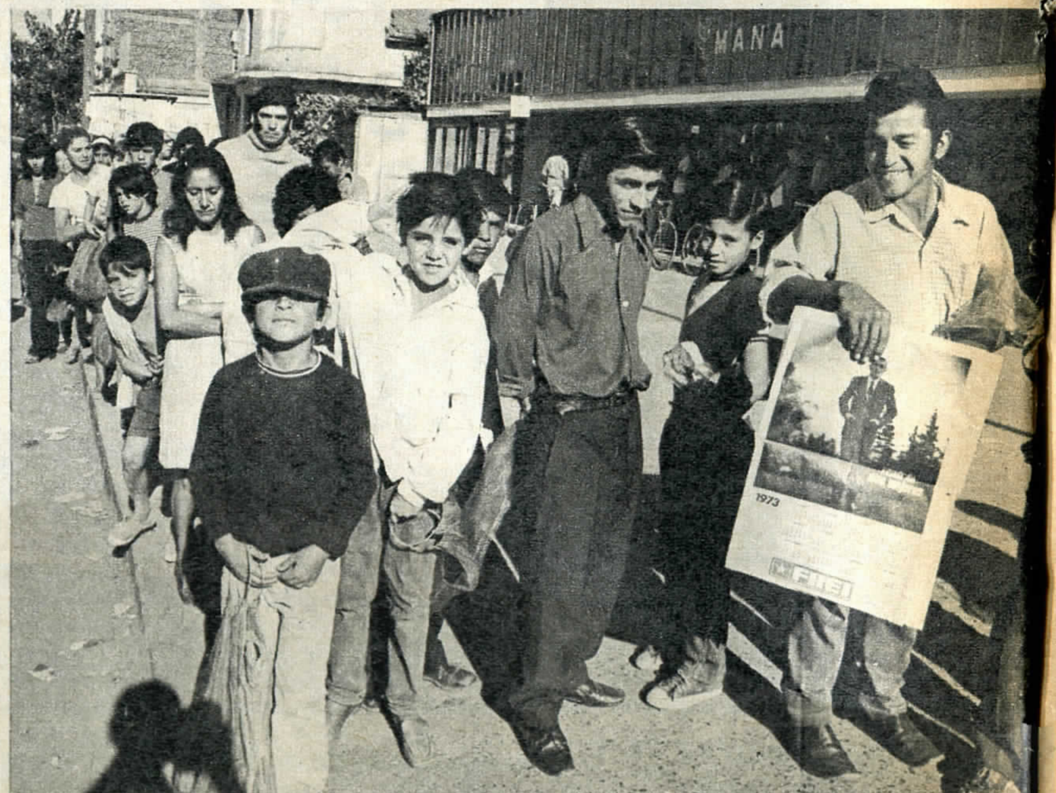
"YA VENDRAN DIAS MEJORES". El hombre muestra la página de un diario con la foto de Frei y la leyenda: "Ya vendrán días mejores". La escena en el barrio Providencia, en la cola de los fideos.

que le hacen falta en trastiendas y pasillos que no son precisamente el Banco Central de Chile.