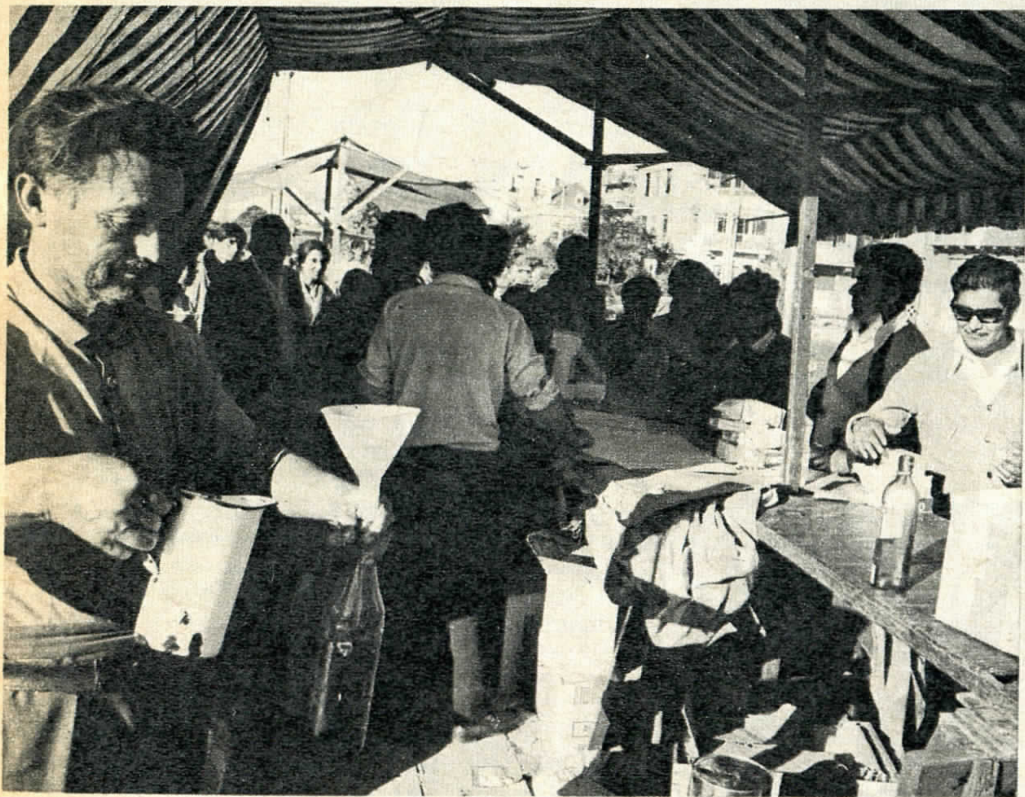
POR UN LITRO DE ACEITE. Domingo, 8 de la mañana. Hoy se vende aceite suelto en la feria que está junto al Mapocho, en la capital. Un litro por persona. La cola llegó a tener cinco cuadras.

guen repuestos. El café instantáneo rinde más.